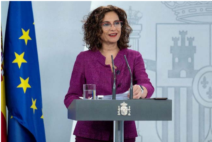
La ministra de Hacienda, María Jesús Montero, ayer en la rueda de prensa tras el Consejo de Ministros en Moncloa.