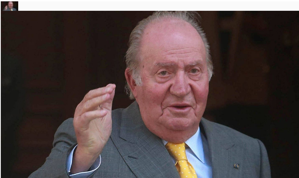
El Rey emérito.

En este sentido, empieza a haber un volumen relevante de consultas de grandes fortunas para mover su residencia fiscal a Dubái, en Emiratos Árabes Unidos , donde hay una cifra cada vez mayor de empresarios, consultores y expatriados en general. Allí fue precisamente donde se movió el rey emérito Juan Carlos.